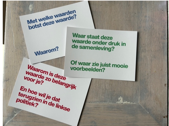
Impressie van het tafelgesprek en de vraagkaartjes