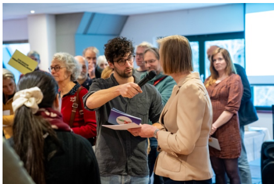
Een impressie van het interactief gesprek